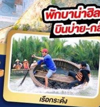
เรือกระด้ง