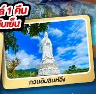
กวนอิมลินห์ฮิ่ง