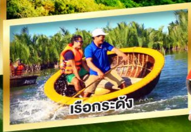
เรือกระดิง