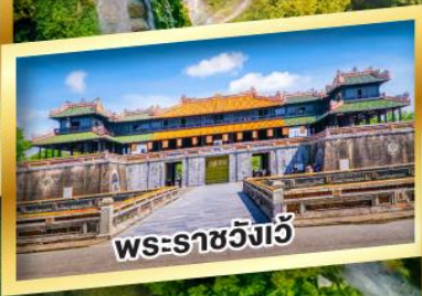
พระราชวังเว้