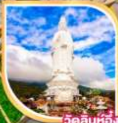
วัดลินห์ฮ้อย