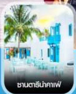
ซานตารีน้ำกาแฟ