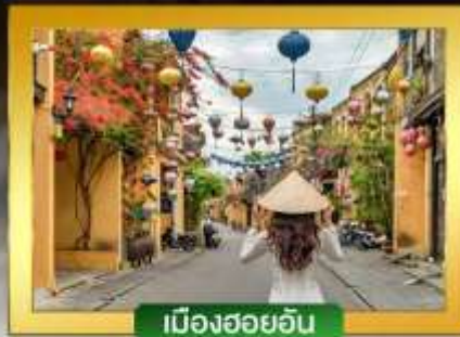
เมืองฮอยอัน