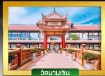
วัดนามเซิน