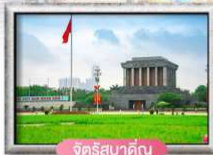
จัตุรัสบาตัญญู