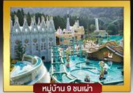
หมู่บ้าน 9 ชนเผ่า