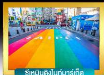
ซีเหมินติงไนท์มาร์เก็ต