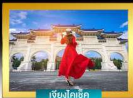
เจียงโคเช็ก