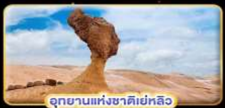
อุทยานแห่งชาติเยลโลว์