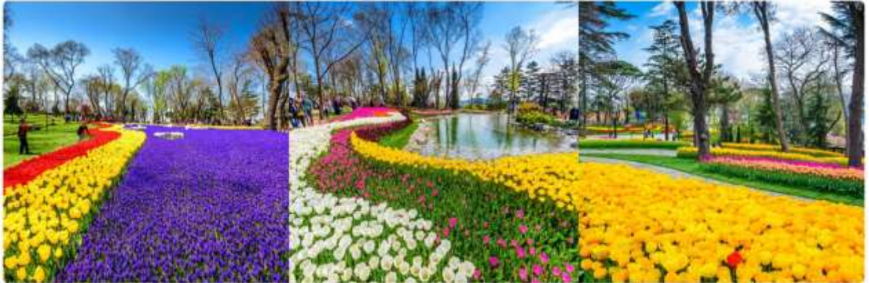
*ภาพเพื่อการโฆษณาเท่านั้น

เทศกาลทิวลิปอิสตันบูล เป็นเทศกาลประจำปี โดยจะจัดในช่วง 3 สัปดาห์สุดท้ายของเดือนเมษายน เพื่อเฉลิมฉลองทั้งฤดูใบไม้ผลิ และความสำคัญของดอกทิวลิป ที่มีต่ออาณาจักรออตโตมัน และวัฒนธรรมตุรกี ปกติแล้วเทศกาลนี้จัดขึ้นที่สวนสาธารณะ ที่มีชื่อเสียงที่สุดของเมือง ให้ทุกท่านได้ถ่ายรูปตามอัธยาศัย