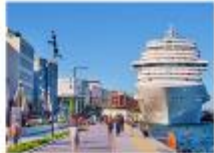
ล่องเรือช่องแคบบอสฟอรัส