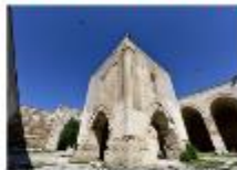
คาราวานสโรน