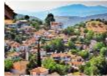
หมู่บ้านออดโตมัน