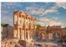
เมืองเอเฟซุส

** พักที่ Le Blue Hotel 5* หรือเทียบเท่า **