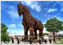
เมืองขานัคคาเล่

** พักที่ Buyuk Truva Hotel 4* หรือเทียบเท่า **