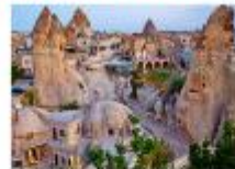
เมืองคัปปาโดเกีย

** พักที่ Under Cave Hotel 5* หรือเทียบเท่า **