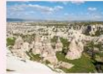
หุบเขาเดเฟเรนท์

** พักที่ Dedeli Cave Hotel 5* หรือเทียบเท่า **