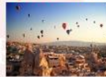
เมืองคัปปาโดเกีย