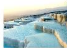
เมืองปามุคคาเล่

** พักที่ Richmond Thermal Hotel 5* หรือเทียบเท่า **