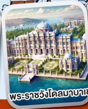
พระราชวังโดลมาบาเซ่