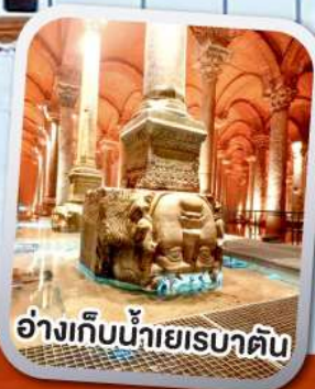
อ่างเก็บน้ำเยเรบาตัน