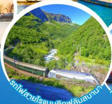
รถไฟสายโรแมนติกฟลินสบานา