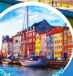
ท่าเรืออูวอน์.โคเปนเฮเกน