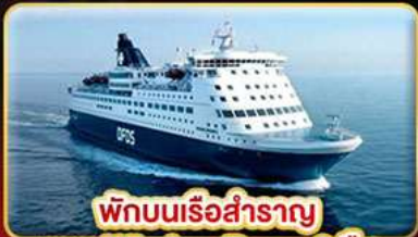
พักผ่อนเรือสำราญ แบบ Window Room 2 คืน