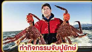
ทำกิจกรรมจับปูยักษ์ “พร้อมเมนูสุดพิเศษ”