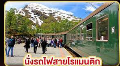
นั่งรถไฟสายโรแมนติก “พร้อมสปาณา”