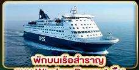
พักผ่อนเรือสำราญ แบบ Window Room 1 คืน