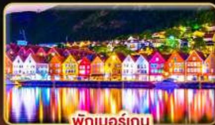
พักเบอร์เกน