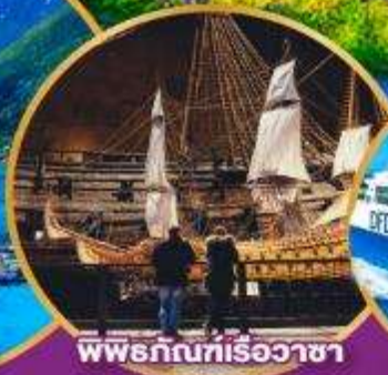
Finnish wooden boat