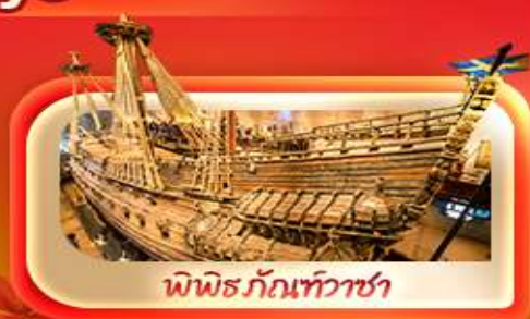
พิพิธภัณฑ์ท้าวชา