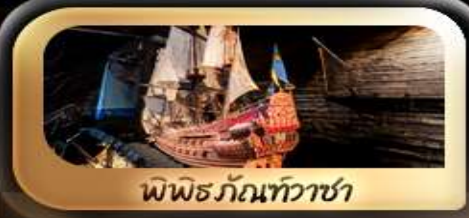
พิพิธภัณฑ์วาลา