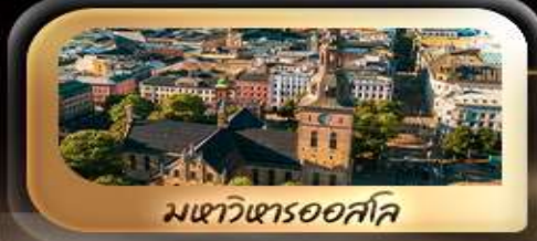
มหาวิหารออสโล