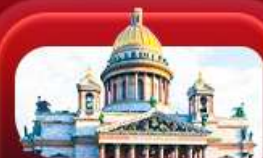
มหาวิหารเซนต์ไอแซค