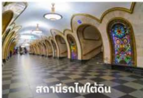
สถานีรถไฟใต้ดิน

บริการอาหารเช้า ณ ห้องอาหารของโรงแรม นำท่านเที่ยวชม สถานีรถไฟใต้ดิน ที่ใครมามอสโกจะต้องได้ลองนั่งรถไฟใต้ดินดูสักครั้ง