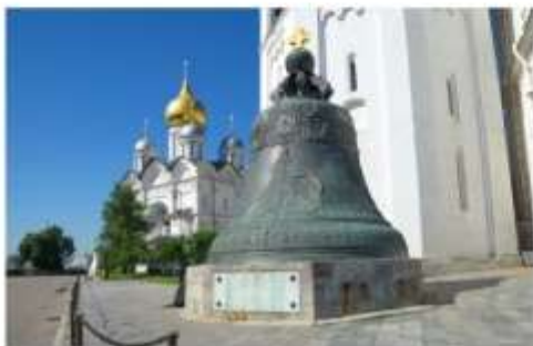
ระบั้งพระเจ้าซาร์

สร้างในสมัยพระนางแอนนาที่ทรงประสงค์จะสร้างระบั้งใบใหญ่ที่สุดในโลกเพื่อนำไปติดตั้งบนหอรบั้ง แต่เนื่องจากมีความผิดพลาดจึงทำให้ระบั้งแตกออก