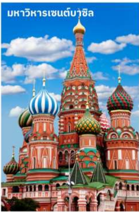
มหาวิหารเซนต์บาซิล

นำท่านถ่ายรูปด้านหน้า มหาวิหารเซนต์บาซิล สร้างในสมัยพระเจ้าอิวานที่ 4 จอมโหด ศิลปะเป็น แบบรัสเซียโบราณ ประกอบด้วยยอดโดม 9 ยอด เพื่อเป็นอนุสรณ์มีชัยชนะในสงคราม ที่มีชัยเหนือพวกมองโกลอย่างเด็ดขาด