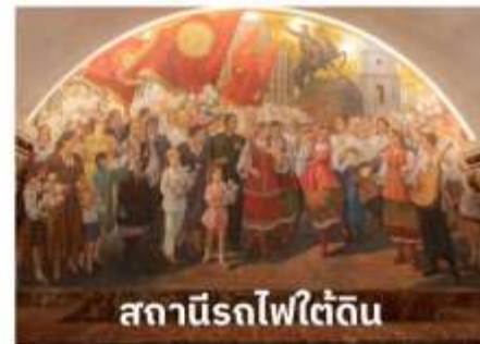
สถานีรถไฟใต้ดิน

เพราะนอกจากจะมีสถานีรถไฟใต้ดินที่สวยงามที่สุดในโลกแล้วยังมีความลึกมากอีกด้วย รถไฟใต้ดินทำให้ผู้คนสามารถเดินทางไปไหนมาไหนได้สะดวกกว่าบนถนนทั่วไป สถานีรถไฟใต้ดินเป็นสิ่งก่อสร้างที่ชาวรัสเซียสามารถอวดชาวต่างชาติให้เห็นถึงความยิ่งใหญ่ ตลอดจนประวัติศาสตร์ความเป็นชาตินิยมและวัฒนธรรมประเพณีอันสวยงาม เป็นเสน่ห์ดึงดูดให้นักท่องเที่ยวมาเยี่ยมชมเนื่องจากการตกแต่งของแต่ละสถานี มีความแตกต่างกันด้วยประติมากรรม โคมไฟระย้า เครื่องแก้ว หินแกรนิต และหินอ่อน เป็นต้น