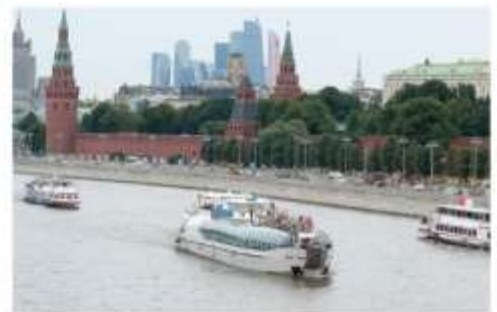
ล่องเรือแม่น้ำมอสโก