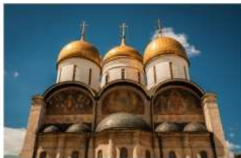
โบสถ์อัสสัมชัญ