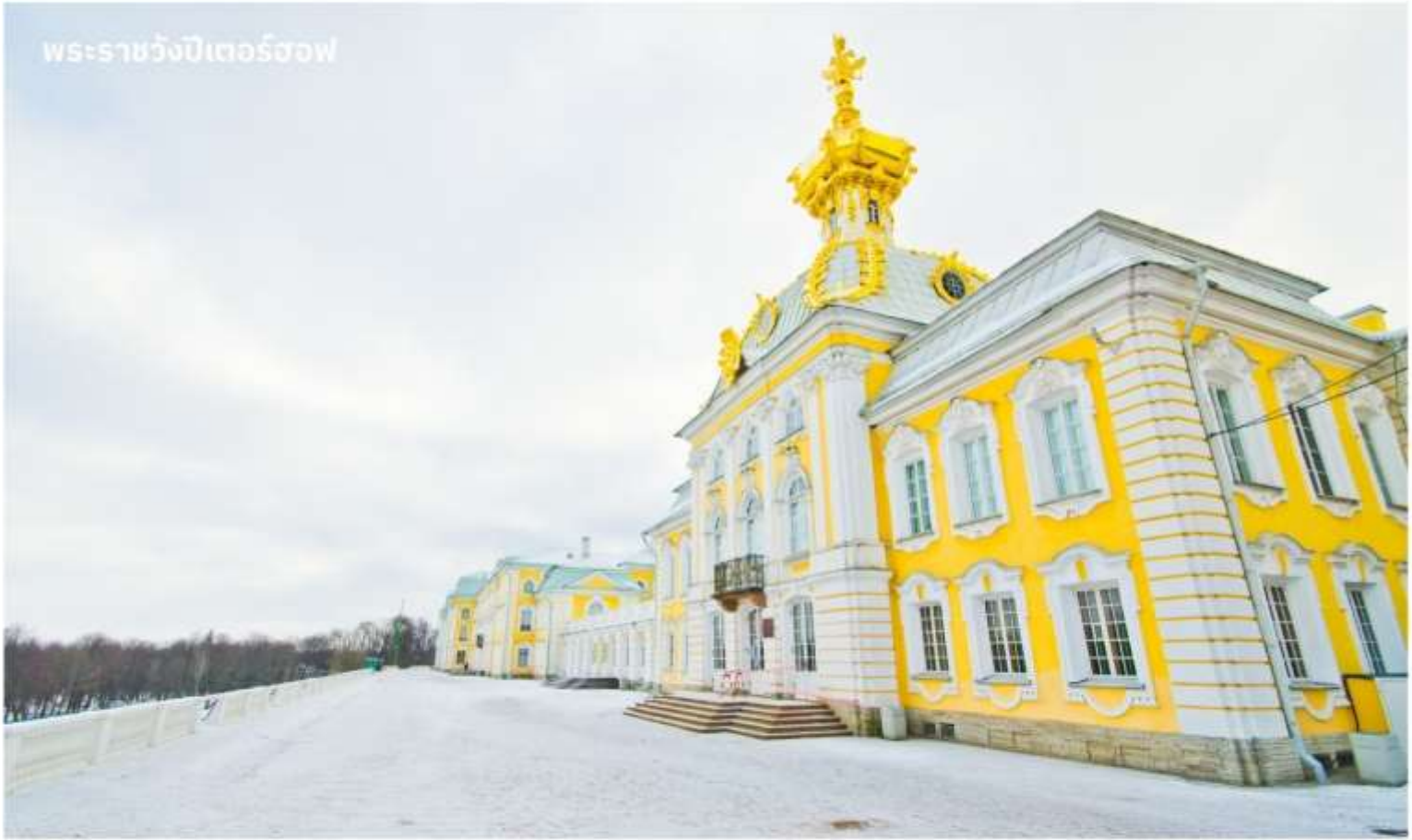
พระราชวังปีเตอร์ฮอฟ