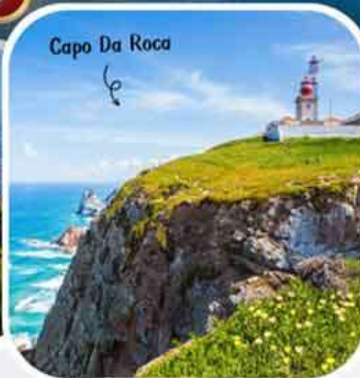
Capo Da Roca