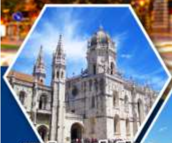
มหาวิหารเจโรนิโม