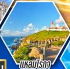
แหลมโรคา