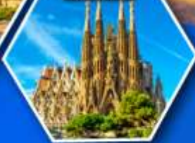
โบสถ์ซากราดา แฟมิเลีย