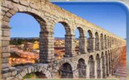
รางส่งน้ำโรมัน เซโกเวีย