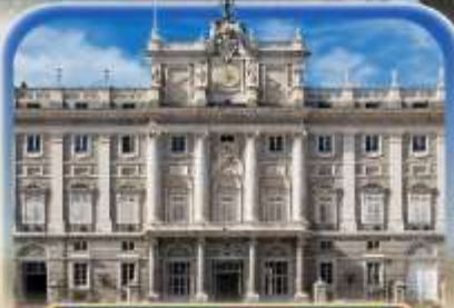
พระราชวังหลวงมาดริด