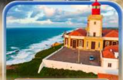
เขื่อนแหลมโรคา