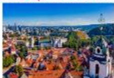
Vilnius Old Town