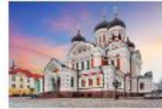
โบสถ์อเล็กซานเดอร์ เนฟสกี

19.35 น. ออกเดินทางสู่อิสตันบูล เที่ยวบิน TK1424