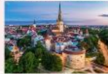
Tallinn Old Town