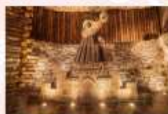
เหมืองเกลือวิลิชก้า