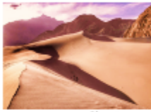
ทะเลทรายคัทปานา