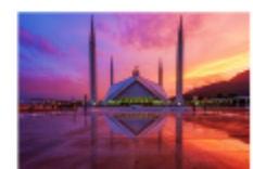
มัสยิดไฟซาล

19.30 น. นำท่านเดินทางสู่สนามบินอิสลามาบัด 23.20 น. ออกเดินทางสู่กรุงเทพ เที่ยวบิน TG350