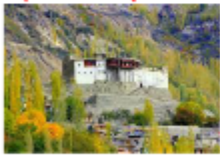
บ้อมบัลดิท