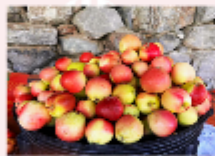
สวนผลไม้ตามฤดูกาล

** พักที่ Duiker Hard Rock Hotel หรือเทียบเท่า **