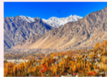
หุบเขาพาสสุ

** พักที่ Sarai Silk Route Hotel หรือเทียบเท่า **