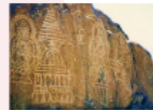
เมืองซีลาส

** พักที่ Shangrila Chilas Hotel หรือเทียบเท่า **