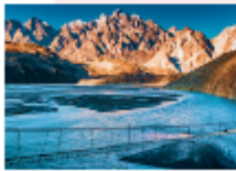
สะพานแขวนอุสโซนิ