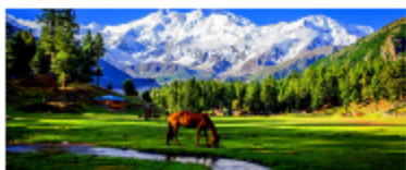
แฟร์มีโควส์