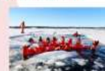
ล่องเรือตัดน้ำแข็ง Ice Breaker