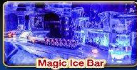
Magic Ice Bar