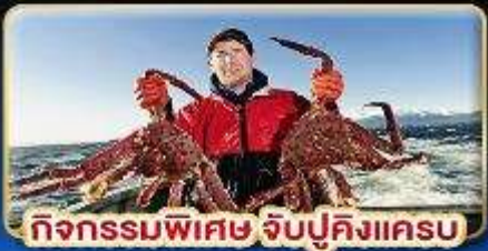
กิจกรรมพิเศษ จับปูคิงแครง