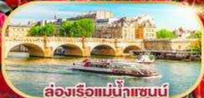
ล่องเรือแม่น้ำแซนน์