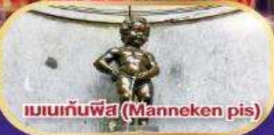
แมนเกนพีส (Manneken pis)