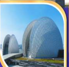
โรงละครหอยโข่งบุก