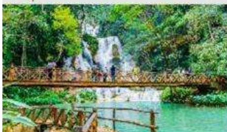
น้ำตกตาดขวางสี