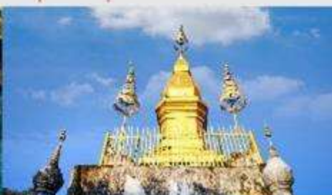
พระธาตุพูสี

*ทางบริษัทฯ ขอสงวนสิทธิ์ในการสลับโปรแกรมทัวร์ตามความเหมาะสมขึ้นอยู่กับสถานการณ์หน้างาน โดยคำนึงถึงผลประโยชน์ของลูกค้าเป็นสำคัญ