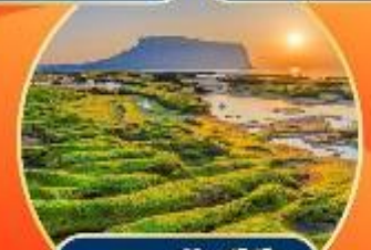
หาดคยองซีกี