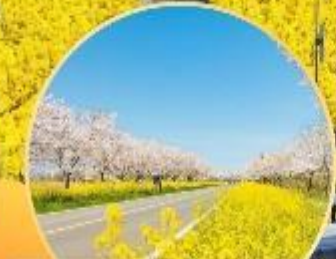
ซากระ / ชุงดอกแรป