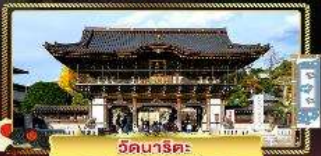
วัดนาริตะ