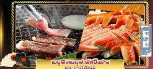
เมนูพิเศษบุฟเฟ่ต์บั้งย่าง และ ซาปายักษ์