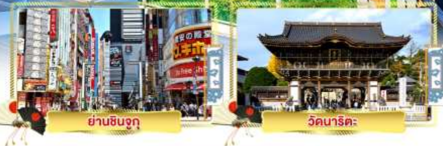
ย่านชินจูกุ