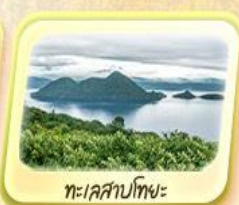
ทะเลสาบโทยะ