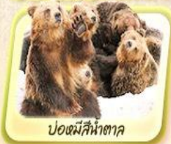
บ่อหมีสีน้ำตาล