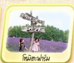
โทมิตะฟาร์ม