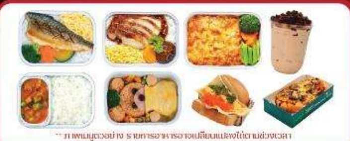
** ภาพเมนูตัวอย่าง รายการอาหารอาจเปลี่ยนแปลงได้ตามช่วงเวลา