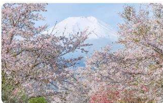
หมู่บ้านน้ำใสโอชิโนะ อักโก

โอชิโนะ อักโก หรือ ที่รู้จักกันในชื่อ หมู่บ้านน้ำใส ความงามแห่งธรรมชาติและวัฒนธรรมที่ ซ่อนอยู่ใต้ภูเขาไฟฟูจิโอชิโนะ อักโก ตั้งอยู่ในหมู่บ้านโอชิโนะ จังหวัดยามานาชิ ประเทศญี่ปุ่น เป็นแหล่งน้ำธรรมชาติที่มีชื่อเสียง ประกอบด้วยบ่อน้ำใสสะอาดทั้งแปดแห่ง ซึ่งน้ำในบ่อเหล่านี้เกิด จากการละลายของหิมะและน้ำแข็งจากภูเขาไฟฟูจิ น้ำที่ไหลลงมานั้นได้ถูกกรองผ่านชั้นหินภูเขาไฟ เป็นเวลาหลายปี จนทำให้น้ำในบ่อมีความบริสุทธิ์และใสจนเห็นถึงก้นบ่อ ไม่เพียงแต่ความงามของ