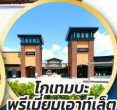
โทเทมบะ พรีเมียมเอาท์เล็ต