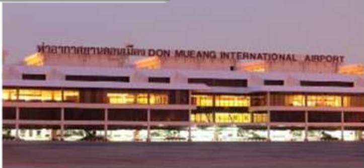
สนามบินดอนเมือง

เวลา 22.00 น.พร้อมกันที่ สนามบินดอนเมือง อาคารผู้โดยสารขาออกระหว่างประเทศเคาน์เตอร์ สายการบินไทยแอร์เอเชียเอ็กซ์เจ้าหน้าที่คอยให้การ ต้อนรับ ดูแลด้านเอกสาร เช็คอิน และสัมภาระใน การเดินทาง