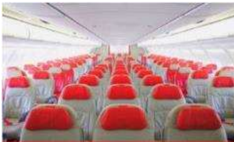
เครื่องลำใหญ่ 377 ที่นั่ง

ตัวเครื่องบินเป็นตัวกรู๊ปสำหรับคณะทัวร์ ระบบของสายการบินจะทำการแรนดอมที่นั่ง ซึ่งไม่สามารถล็อกหรือเลือกที่นั่งได้ หากลูกค้าต้องการเลือกที่นั่ง ทางสายการบินมีบริการอัฟเกรดที่นั่ง (ค่าบริการเป็นไปตามที่สายการบินกำหนด)