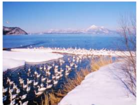
ทะเลสาบอินาวะชิโร Inawashiro-ko