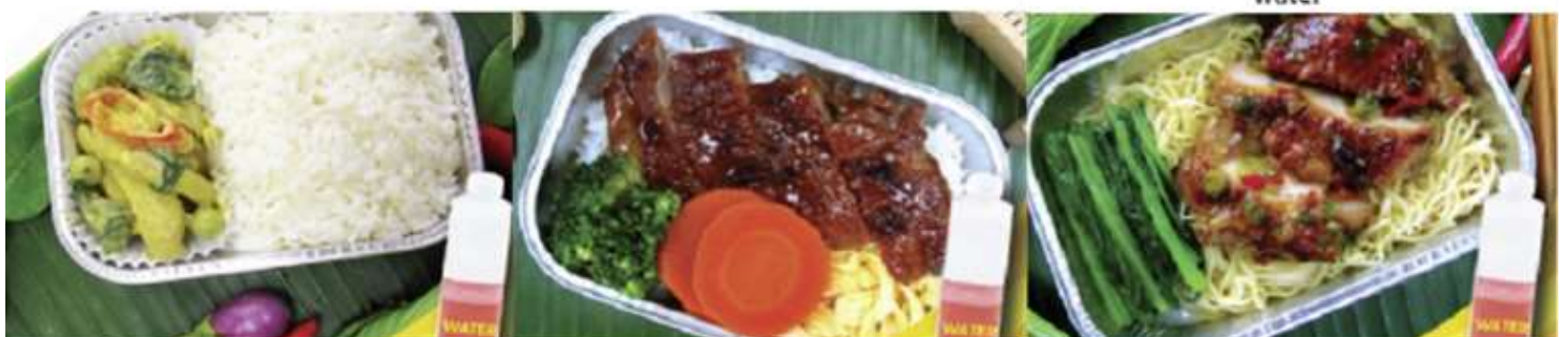
Chicken roasted with herb and noodle and water