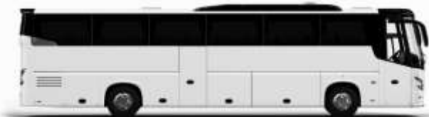
ตัวอย่างรถทัวร์ 1 ชั้น

ค่าที่พักตามที่ระบุในรายการหรือเทียบเท่าระดับเดียวกัน (พักห้องละ 2 ท่าน) หากประเภทห้องที่ท่านริเวทมาเดิม อาทิ เช่น 5 เควสห้องพักเป็น TWIN BED หรือ DOUBLE BED ทางบริษัทขอสงวนสิทธิ์ในการปรับประเภทห้องพัก เป็นตามที่โรงแรมมีอยู่ โดยไม่ต้องแจ้งให้ทราบล่วงหน้า