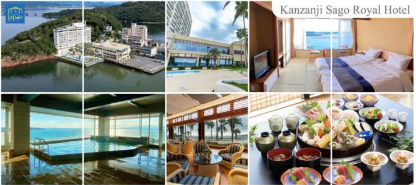
Kanzanji Sago Royal Hotel