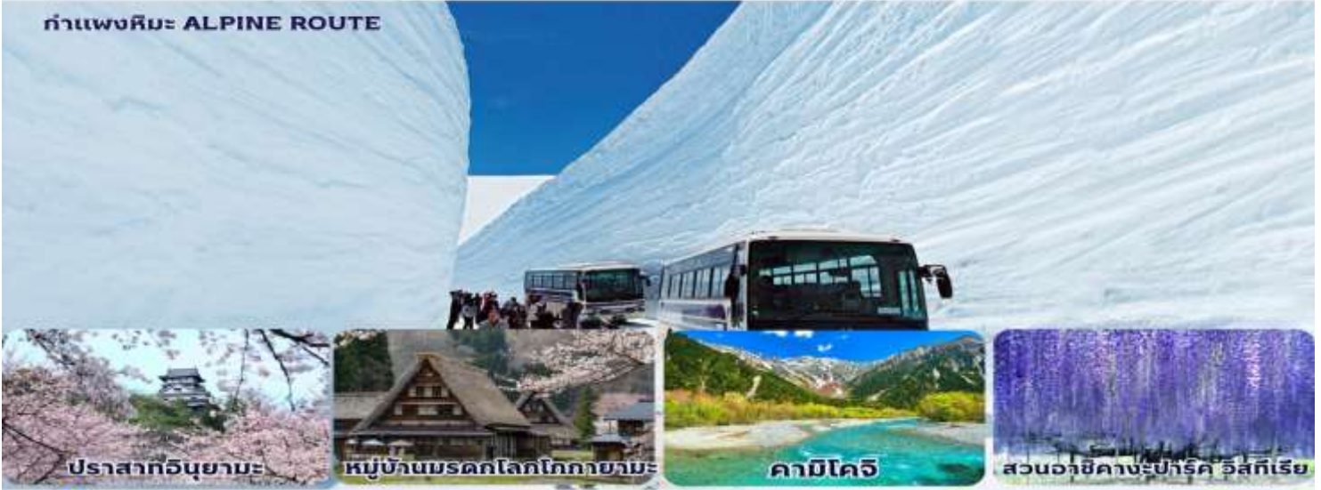
ปราสาทอินุยามะ