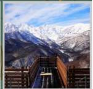
"HAKUBA MOUNTAIN HARBOR"