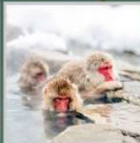
"SNOW MONKEY PARK"