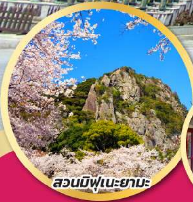
สวนมิฟูเนะยามะ