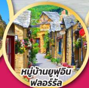
หมู่บ้านยูฟูอิน พลอร์ริล