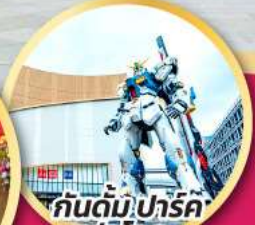
กันดั้ม ปาร์ค ฟุกุโอกะ