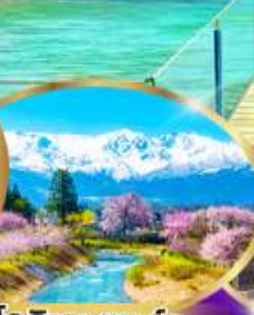
โอฮิเดะ พาร์ค