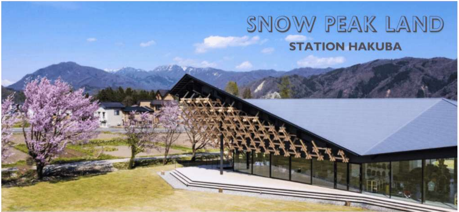
รูปใช้ประกอบการโฆษณาเท่านั้น