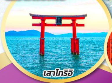
เสาโทริอิ