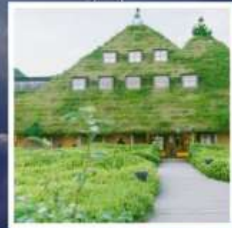
ลา โคสึน่า โอมิสะจิมัง

พิเศษท่องเที่ยวสวนสนุกยูนิเวอร์ซัล สตูดิโอส์เต็มวัน สวนสาธารณะซากุระปราสาทคาคาโตะ 1 ใน 3 สุดยอดจุดชมซากุระแห่งญี่ปุ่น สักการะพระพุทธรูปในอาคาร ที่ใหญ่ที่สุดในญี่ปุ่น เอจิเซ็นโดบุตสึ เปิดประสบการณ์อัศจรรย์กำแพงหิมะ บนเทือกเขาเจแปนแอลป์ ชมประวัติศาสตร์และร้านขนมดังลา โคสึน่า แห่งเมืองโอมิสะจิมัง พักออนเซ็นอย่างดี 3 คืน 2 ริมทะเลสาบ!!! อาหารพิเศษ...บุฟเฟ่ต์อาหาร + เครื่องดื่มแอลกอฮอล์ไม่อั้น กรุ๊ปสบายๆ เพียง 20 ท่านเท่านั้น!!!