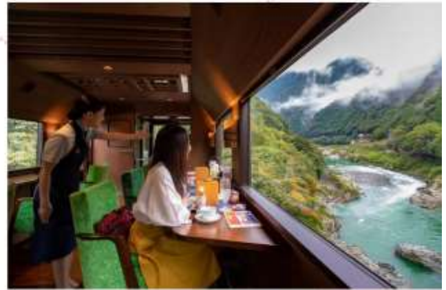
รับประทานอาหารกลางวัน ภายในรถไฟ (เมนูอาหารไม่สามารถเปลี่ยนได้)