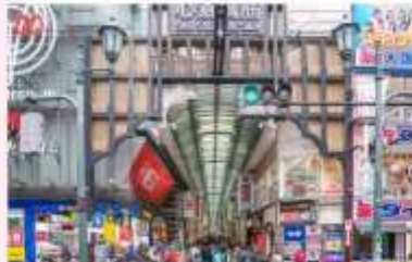
SHOP AT SHINSAIBASHI