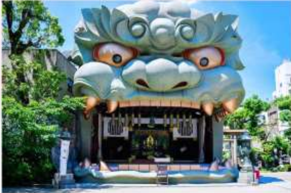
YASAKA NAMBA SHRINE