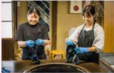
MAKE INDIGO DRING