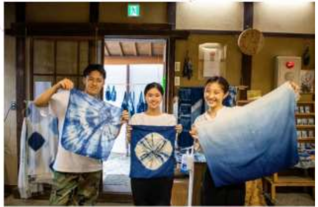
รับประทานอาหารกลางวัน ณ กัตตาคาร