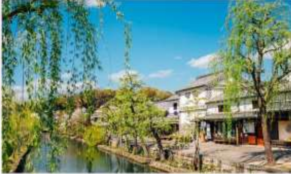
KURASHIKI BIKAN HISTORICAL QUARTER