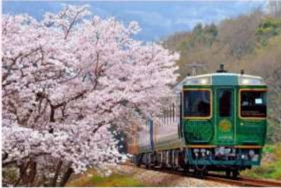
SHIKOKU MANNAKA SENNEN MONOGATARI