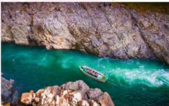
TAKE BOAT AT OBOKE KOBOKE