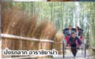
นั่งรถลาก อาราชิม่า