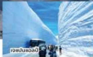
เจแปนแอลป์